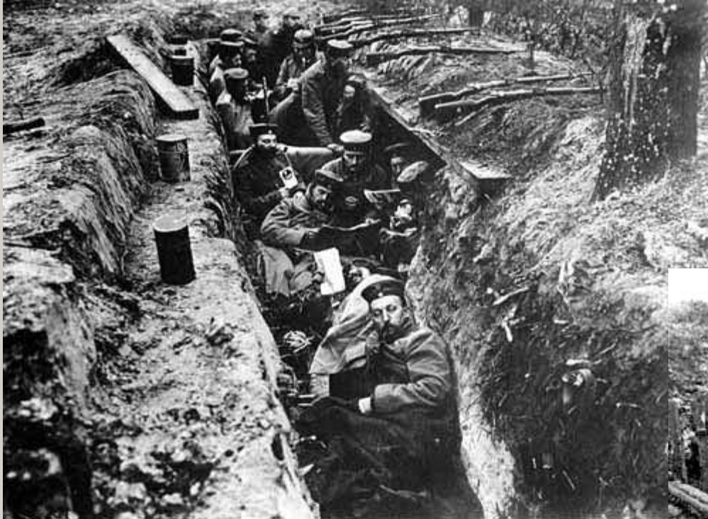
Soldados alemães numa trincheira